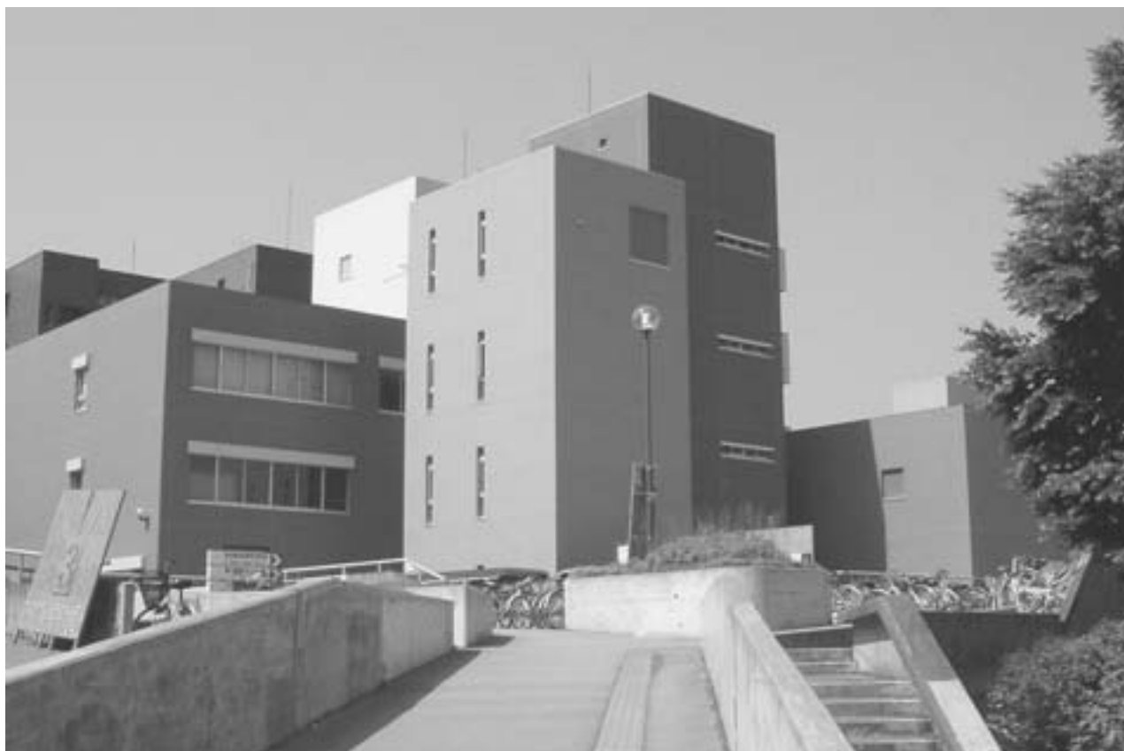
【第一学群棟外壁リニューアル】