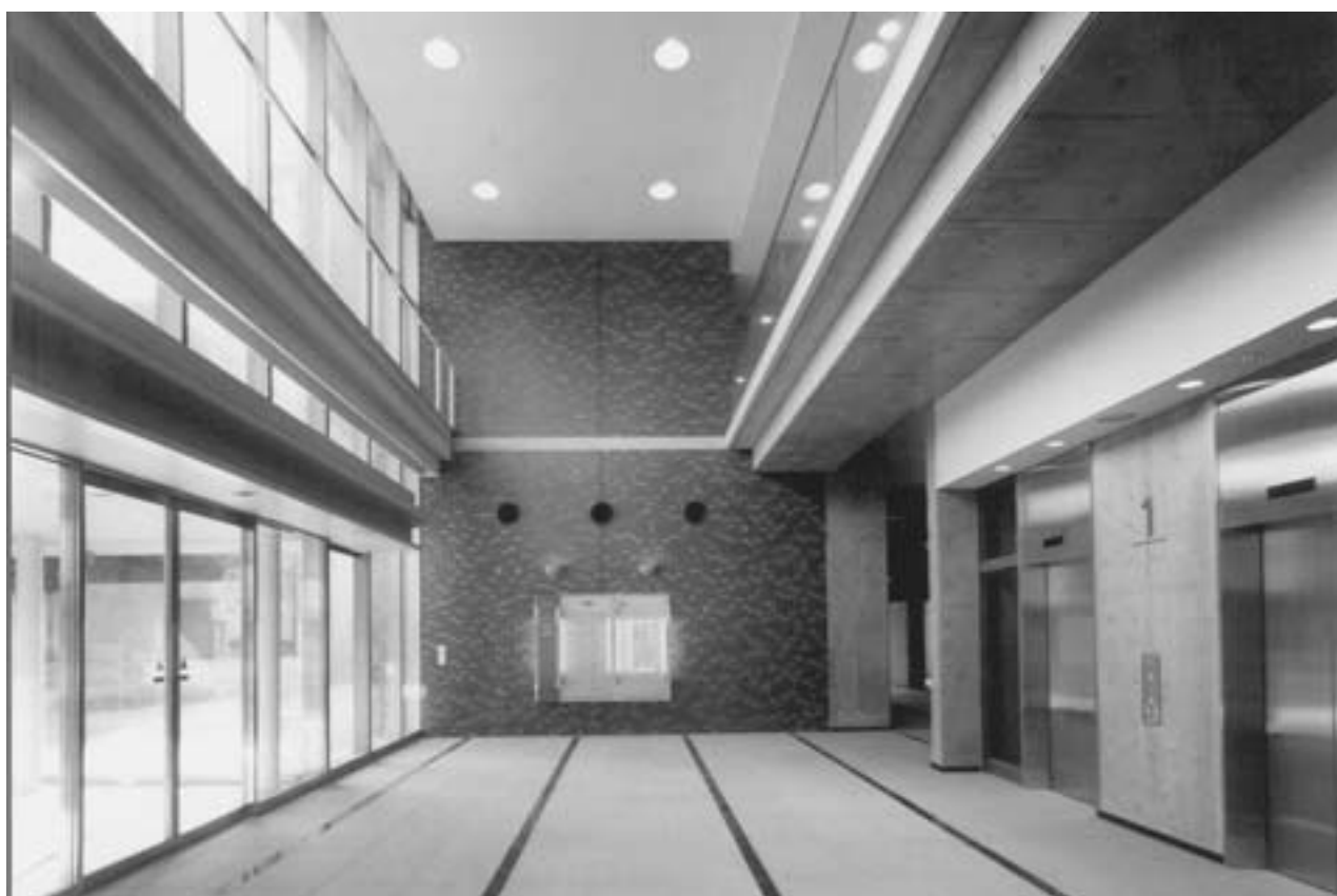
【総合研究棟A（エントランスホール）】