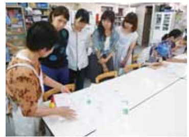
利用者たちと一緒に作業を体験

「工房わかぎり」は、知的障がい者に働く場を提供し日々の生活や作業を通して社会自立への援助を行っている作業所で、その親たちによって組織されています。