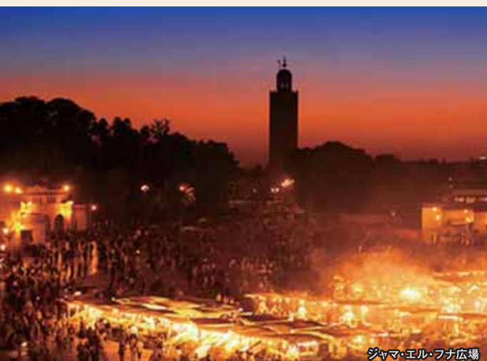
ジャマ・エル・フナ広場

マラケシュで有名な料理といえば「タンジーヤ」。マラケシュの人々は、タンジーヤという壺形の土鍋に、ヤギなどの肉や豆、レーズン、いろいろなスパイス、水などを入れ、「フラン」(オープンの意)と呼ぶ店に持っていき、日本円で100円〜150円