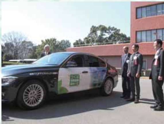
藻類産オイルと軽油を混ぜた燃料を使った自動車のデモ走行も成功

研究が続けられてきましたが、増殖が遅くオイル産生効率が低いという問題がありました。遺伝子操作で品種改良をしようにも、細胞の殻が硬く、従来の遺伝子導入技術が使えなかったのです。様々な手探りの末、ごく最近、ようやく新しい遺伝子導入技術が完成し、これから飛躍的に品種改良が進むと期待されています。