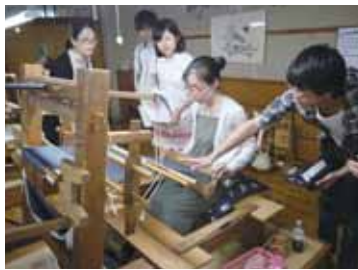
旗織り機の説明に熱心に聞き入る学生たち

このプロジェクトは、茨城県の伝統工芸「結城紬」を、本学や筑波研究学園都市の関係者が身近に接する機会を提供し、結城紬産業の活性化に資することを目的としています。本学教職員、紫峰会、茨城県繊維工業指導所などの有志による産学官連携プロジェクトに端を発して、昨年度からUTclubの班として活動を行っています。