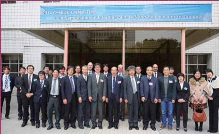
今年の1月にはドイツ・中国の研究機関と合同シンポジウムを開催した