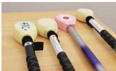
手づくりのタッピング棒