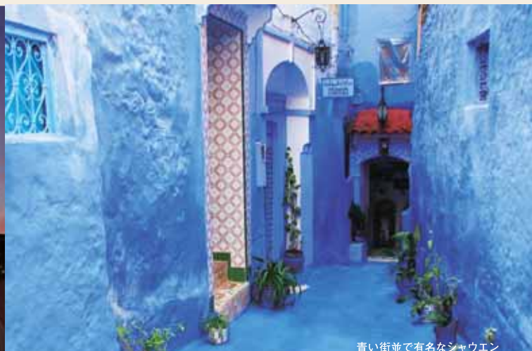
青い街並で有名なシャウエン