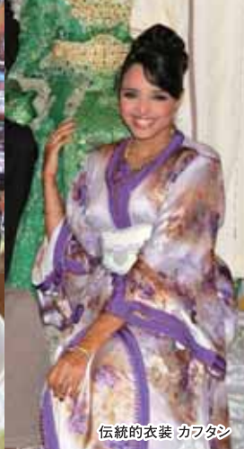
伝統的衣装 カフタン