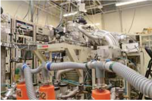
固体表面での反応を解析するための超音速分子線装置