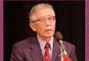
開所式典で挨拶する白川英樹名誉教授