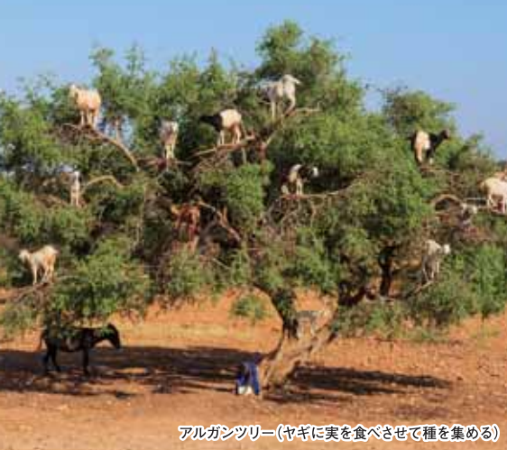
アルガンツリー(ヤギに実を食べさせて種を集める)