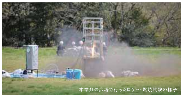
本学虹の広場で行ったロケット燃焼試験の様子