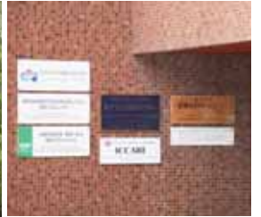
センターの活動は2つの建物に分散して行われている