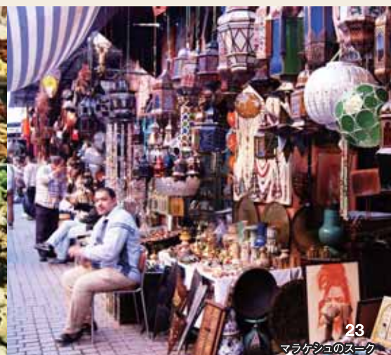
マラケシュのスヌーク