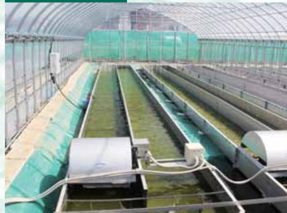
藻類バイオマスの大量培養を行うための大規模実証施設

未知の種も含めると1000万種を越えると言われる藻類の中から、選んだのは2つ、ポトリオコッカスとオーランチオキトリウムです。両種とも石油の主成分である炭化水素オイルを産生しますので、そのオイルは運輸燃料として最適な原料であり、さらに化学製品や化粧品などの原料にもなります。まさしく、石油代替バイオオイルと言えます。まさしく、ポトリオコッカスは、1960年代から基礎