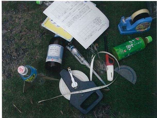
図1 10年以上前に作られたロケット（左）と，実験用具一式（右）