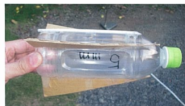
図8 改良新型三枚翼機

(1) エタノールロケットの改良を重ねた結果、表8の1番、2番のように、安定して飛距離を出せる機体を開発できた。新型機を図8に示した。