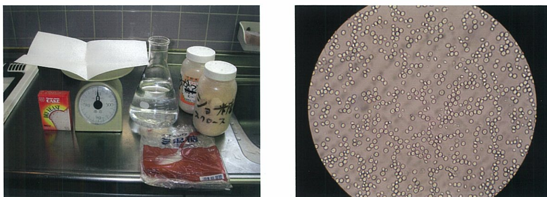
図 6 アルコール発酵の準備 (左) と、活性酵母の顕微鏡写真 [600 倍] (右)