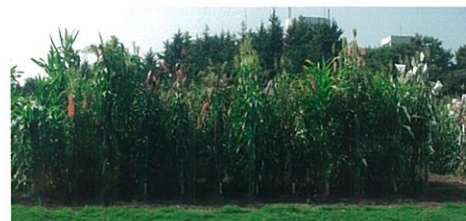
図9 世界のソルガム各種

(3) 今回、発酵基質としてショ糖を用いたが、人が食べられる有機物はなるべく食料にした方がよい。畑の雑草のように十分に利用されない生物資源や、食べられなくてもかまわないから、やたらと成長の早い植物を作って利用すべきだと思う。