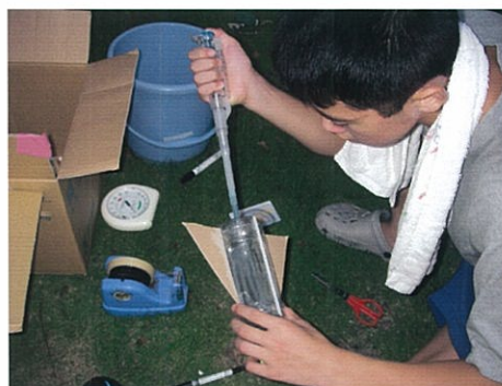
図2 掃除機で換気し（左），機械式ピペットで正確に燃料を注入する（右）