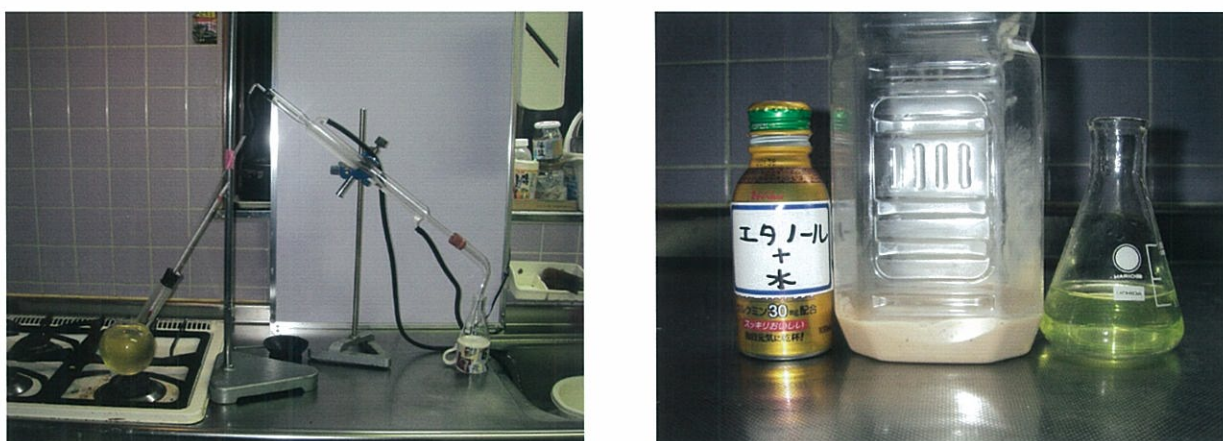
図 7 冷却管を用いた蒸留装置（左）と、蒸溜後の液（右の三角フラスコ）

実験 2A で得た、濁りのない上澄み液を、図 7 の蒸留装置を用いて分留した。加熱を始めると、すぐに小さな泡が出始めたが、これは発酵で生じた二酸化炭素なので冷やしても液化しない。その後、80℃を超えると、冷却管内に液体を確認できたので、火加減を調節して、温度が上がりすぎないようにした。エタノールの沸点は 78.4℃だが、ガスコンロの熱気が丸底フラスコの周りを回って上にあがるため、温度計は 90℃前後で安定した。93℃を越えるようになったところで蒸溜をやめた。