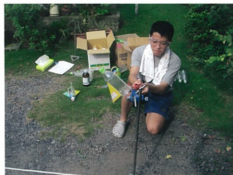
図3 実験スタンドを用いた発射台（左）と，点火のしかた（右）