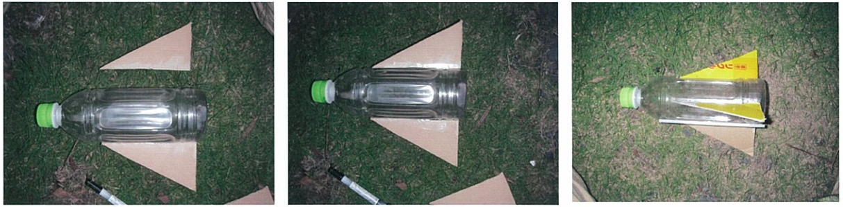
図4 翼の付け方（左から、下に1枚、水平に2枚、120度間隔に3枚）