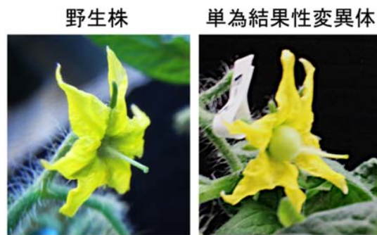
図1 新規変異体を示す単為結果による着果

野生株では雄しべを取り除いた受粉していない花(未受粉花)は果実を実らせないのに対し、新たに発見された単為結果性変異体では未受粉花も果実を実らせた。写真は開花から3日後の未受粉花の様子。