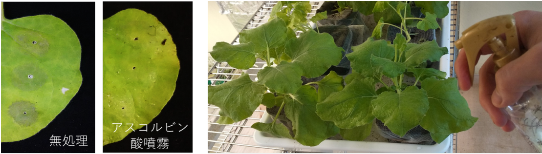
図1. アスコルビン酸噴霧（右）による壊死の抑制。発現させるタンパク質の種類によっては、壊死（黒ずんでいる箇所）が引き起こされました（左）。一方で高濃度（100 mM 以上）のアスコルビン酸を噴霧することで、壊死が抑制されました（中）。