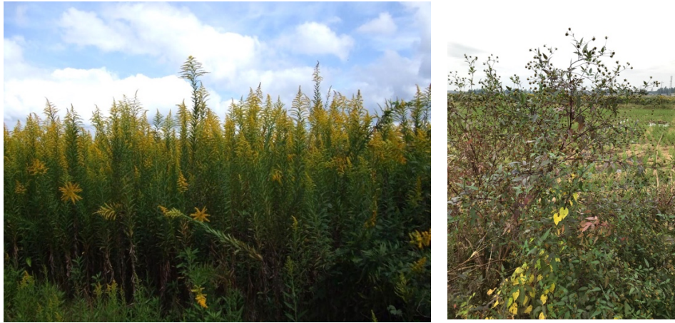
図3. 保全植物の繁殖に影響を及ぼす可能性が示された外来植物（左：セイタカアワダチソウ、右：コセンダングサ）