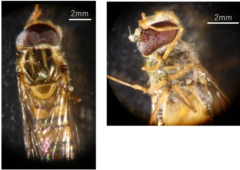
図1. ホソヒラタアブの体表に付着した花粉。花粉は体表のあらゆる部位に付着する。