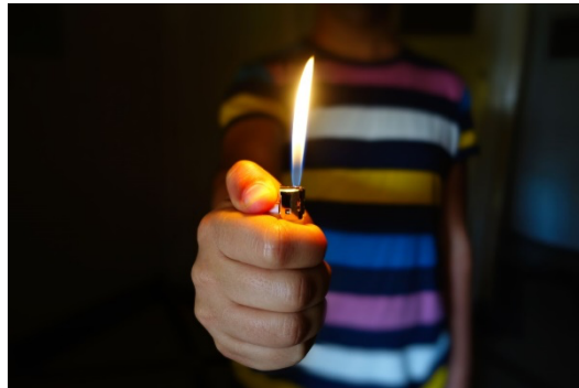
子どもの火遊び