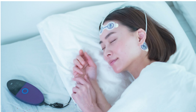
図1. InSomnograf (インソムノグラフ) の外観 (論文の Supplementary Figure 1 より)