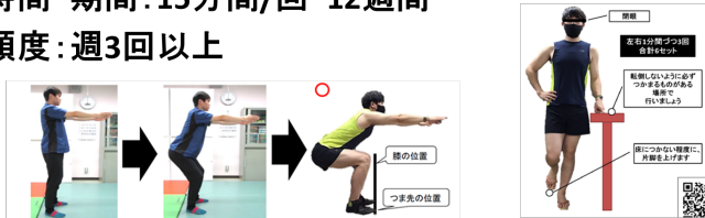
図1 スクバラ®によるトレーニングプログラム