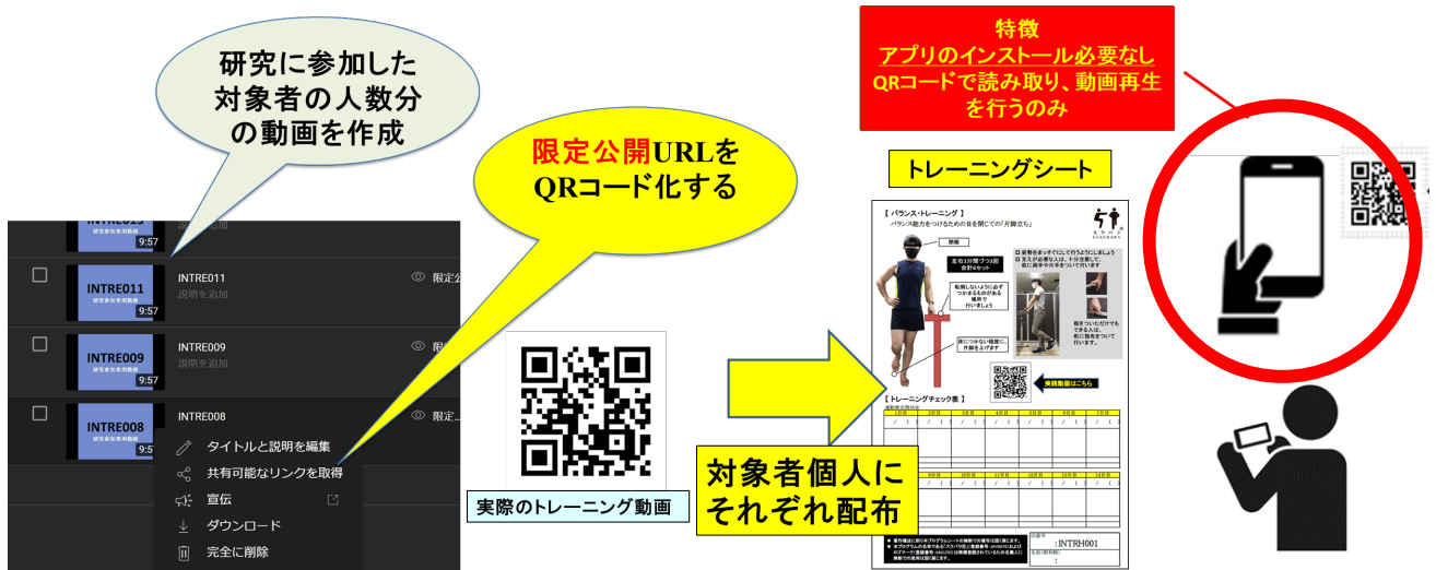
図2 動画視聴方式の概要

各参加者専用に割り当てた動画を提供し、トレーニング時に参加者所有のスマートフォン等で再生する。