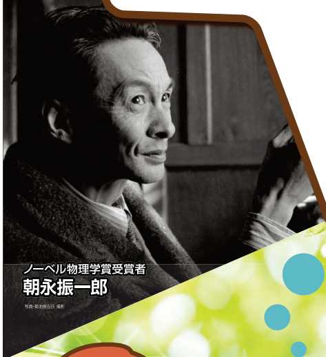
ノーベル物理学賞受賞者 朝永振一郎